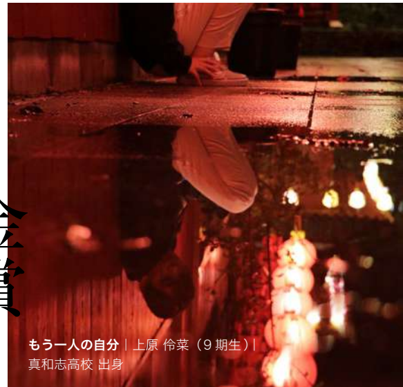
もう一人の自分 | 上原 伶菜 (9期生) | 真和志高校 出身