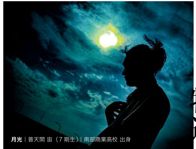
月光 | 普天間 宙 (7期生) | 南部商業高校 出身