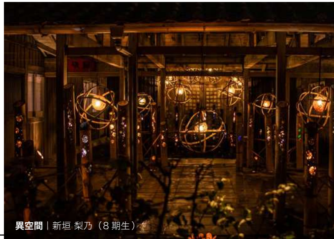
異空間 | 新垣 梨乃 (8期生)