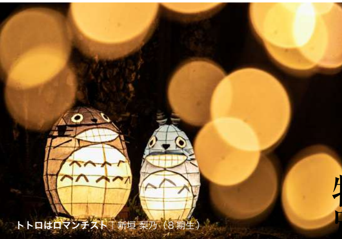
トトロはロマンチスト | 新垣 梨乃 (8期生)